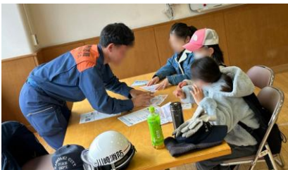
柿生小学校の子どもたちとコラボして、防災学習発表や、SDGsの啓発活動のブースも設置