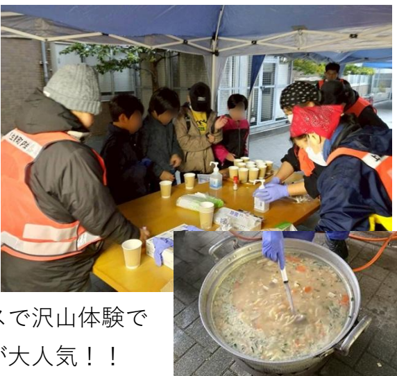
雨天でしたが、室内または屋根ブースで沢山体験できました。炊き出しの『きつね汁』が大人気！！